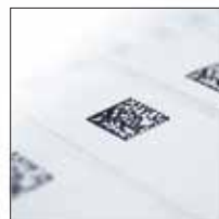
Códigos de Barra HD